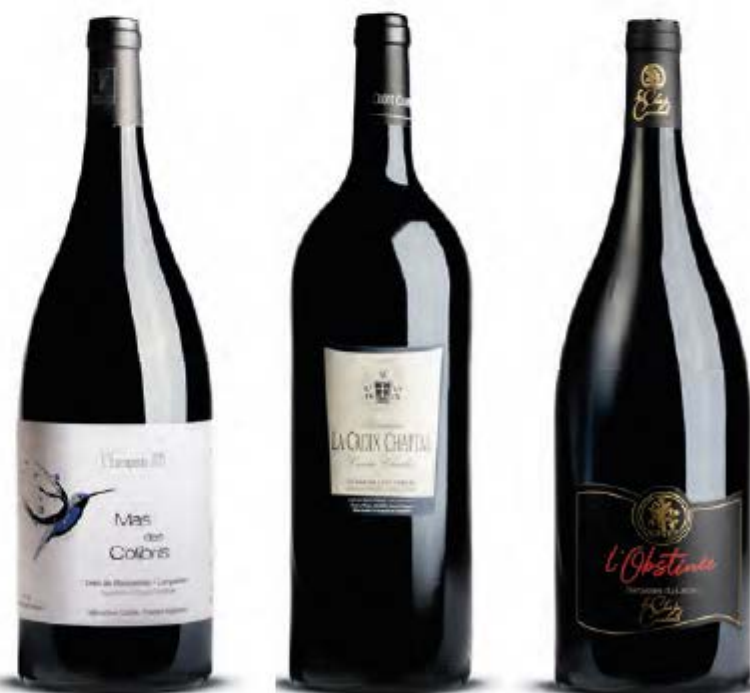
Mas des Colibris - L'escapade 2019 IGP St Guilhem le Désert Domaine La Croix Chaptal – Cuvée « Charles » 2010 AOP Coteaux du Languedoc Clos des Combals – l'Obstinée 2018 IGP St Guilhem le Désert